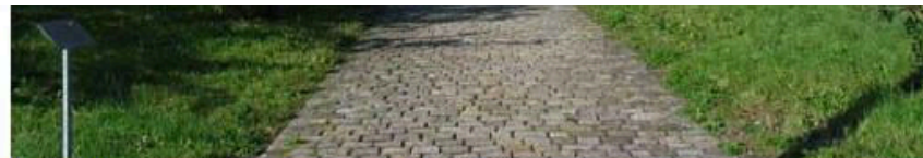
Das Gebäude des Schweizerischen Bundesarchivs